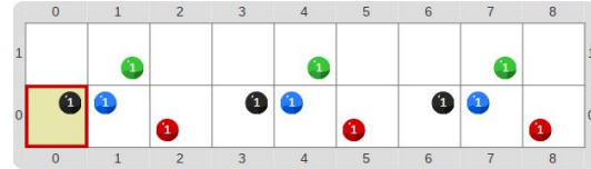
(a) Tablero inicial